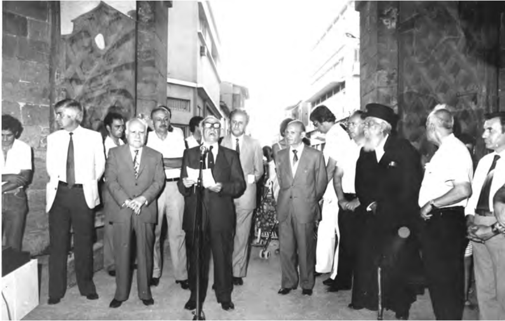
Εκδήλωση μνήμης κατεχομένων, 30 Ιουνίου 1984, Πύλη Αμμοχώστου

του αιμοσταγούς Ατίλα. Αγέρωχος, όμως, μας κοιτάζει επίμονα στα μάτια, περιμένοντας να τον δρασκελίσουμε, να ανοίξουμε τις πόρτες που οδηγούν στην Κερύνεια, στα Βαρώσια, στον Απ. Ανδρέα, στη Μόρφου, στην Κυθρέα και τα περικόρα τους, στα σπίτια και τις εκκλησίες μας.