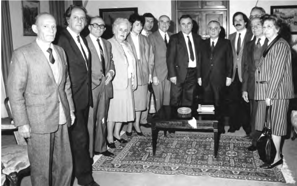
Συνάντηση με τον πρόεδρο της Δημοκρατίας Αντιπροσωπείας του Δήμου Νέας Σμύρνης και του σωματείου Ελεύθερη Κυθρέα, Μάρτιος 1986. Εκδήλωση «Μνήμη Σμύρνης».

δηκόντων μου. Γιατί εκείνη την εποχή ο δάσκαλος ήταν μεταξύ των ελαχίστων μορφωμένων στα χωριά της Κύπρου μας και οι φτωχοί και ταλαίπωροι εργάτες και γεωργοί, θεωρούσαν το δάσκαλο και τον ιερέα συμβούλους τους σε κάθε τους δυσκολία. Τους θεωρούσαν ως τους μόνους, που θα τους ενημέρωναν για θέματα εθνικά και δρασηκευτικά, θα βοηθούσαν στην πρόοδο της κοινότητας τους. Αυτό απαιτούσε η εποχή, αυτό απαιτούσαν οι τότε καταστάσεις και νομίζω πως εγώ έκαμα απλώς το καθήκον μου.