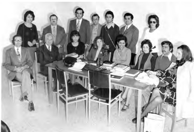
Ο καθηγητικός Σύλλογος