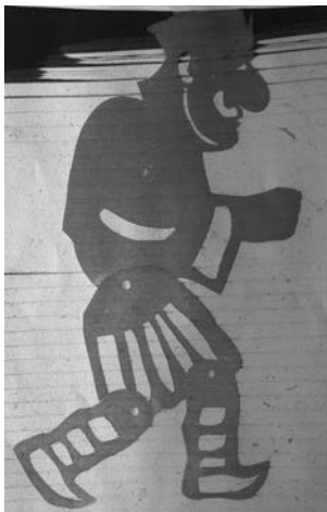
Μπαρπαγιώργος (1982) Χαρτόνι 60,5 cm

Σε σχετική ερώτησή μου για την πολιτική τοποθέτηση του Τσέλιγκα μου είπε ότι δεν ανήκε πουθενά, ήταν ανεξάρτητος.