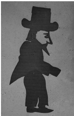
Διονύσιος (1982) Χαρτόνι 53 cm