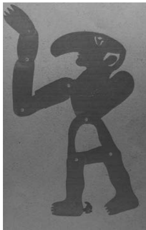
Καραγκιόζης (1982) Χαρτόνι 49 cm.