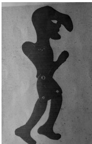
Κολλητήρι (1982) Χαρτόνι 33,5 cm