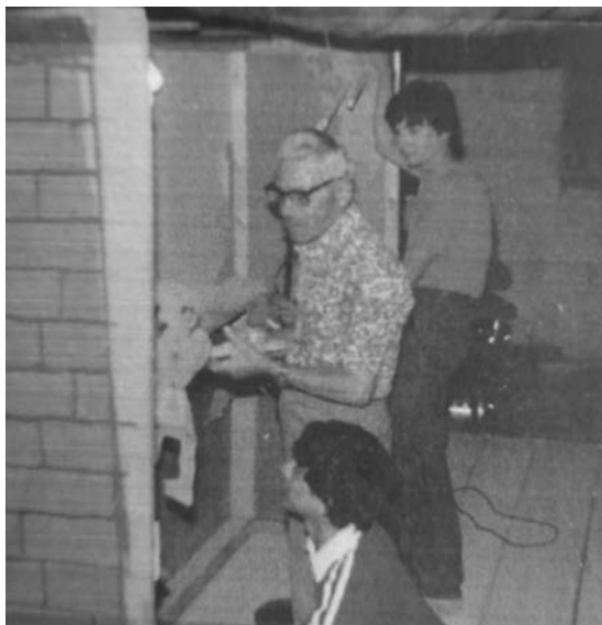
Επί το έργον, Πενταλιά 15.8.1982