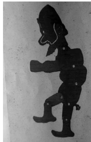
Εβραίος (1982) Χαρτόνι 53,5 cm

Ξαναεπισκέφθηκα τη κα Χριστίνα στις 3/8/2000 και αγόρασα άλλες 5 φιγούρες: τον Βεληγκέκα, Εβραίο, Πασά, Σταύρακα (με το καπέλο του που μπαίνει και βγαίνει) και Ομορφονιό.