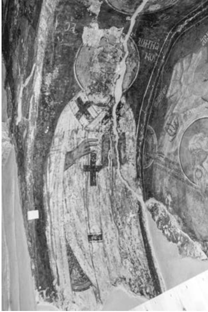
Εικ. 4. Χούλου, ναός Παναγίας, τοιχογραφία αρχών 16ου αιώνα.