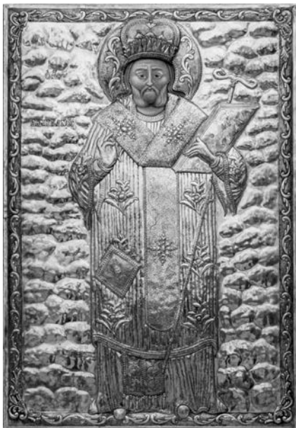
Εικ. 6. Φλάσου, ναός αγίου Δημητριανού, αμφίγραπτη εικόνα, εμπρός όψη, 1865.