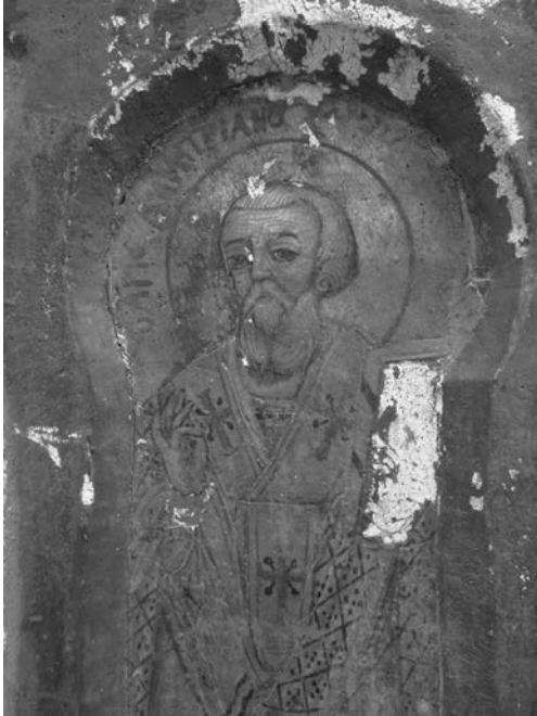
Εικ. 8. Κάτω Λακατάμια, ναός αγίας Παρασκευής, βημόθυρο 19ου αι. (λεπτ.).