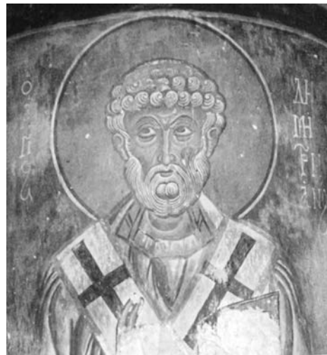
Εικ. 3. Καλογραία, ναός Χριστού Αντιφωνητή, τοιχογραφία τέλους 12ου αι. (λεπ.).