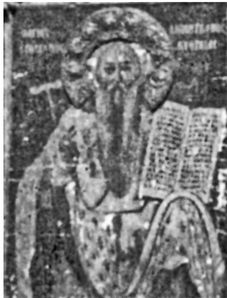
Εικ. 7. Κυθρέα, ναός Παναγίας Χαρδακιώτισσας, εικόνα του 1805

Στον 19 ο αιώνα χρονολογείται η εμπρόσθια όψη (εικ. 6) της αμφίγραπτης προσκυνηματικής εικόνας του αγίου Δημητριανού από τη Φλάσου 13 , που μνημονεύσαμε παραπάνω. Ο άγιος παριστάνεται μετωπικός με πλήρη αρχιερατική αμφίεση συμπεριλαμβανομένης και μίτρας, στοιχείο νεωτερικό από εικονογραφικής πλευράς, που δεν απαντάται στις παλαιότερες απεικονίσεις του. Η εικόνα είναι καλυμμένη με αργυρή μεταγενέστερη επένδυση, από την οποία μένει ακάλυπτο το πρόσωπο του αγίου.