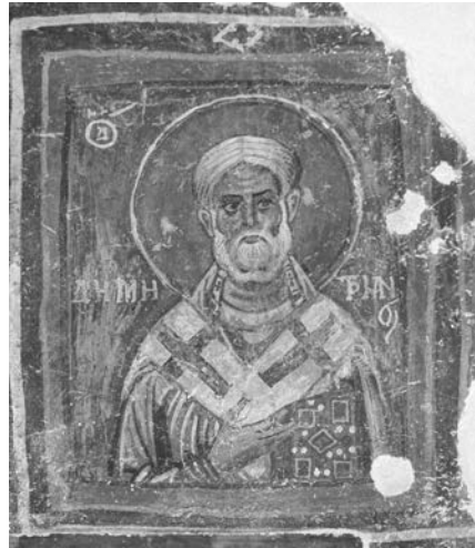
Εικ. 1. Κακοπετριά, ναός αγίου Νικολάου της Στέγης, τοιχογραφία 11ου αι.

Μεταξύ των συνώνυμων αγίων Δημητρίων 1 ξεχωριστή θέση κατέχει ο ιεράρχης των αρχαίων Χύτρων (σημ. Κυθρέας), τοπικός άγιος της Κύπρου († μετά το 915), ο οποίος εορτάζει στις 6 Νοεμβρίου 2 και παριστάνεται ως επίσκοπος σε τοιχογραφίες και φορητές εικόνες βυζαντινών και μεταβυζαντινών ναών της Κύπρου 3 . Σε ορισμένες απεικονίσεις του φέρει την ονομασία της επισκοπής του, η οποία αναφέρεται ως Κυθρέα . Ως εκ τούτου δημιουργείται πρόβλημα αν πρέπει πάντα να ταυτίζεται με τον επίσκοπο Χύτρων' λ.χ. όπου απεικονίζεται με τον Μακεδόσιο, πιθανώς να έχουμε τον ομώνυμο επίσκοπο Ταμασού, του οποίου σώζονται δυο εικόνες του 18 ου αιώνα, καθώς και ερειπωμένος ναός στο χωριό Πέρα της επαρχίας Λευκωσίας 4 . Σε όλους σχεδόν τους υφιστάμενους ναούς της Κύπρου, που φέρουν σήμερα το όνομα Άγιος Δημητριανός, τιμάται ο επίσκοπος Χύτρων 5 .