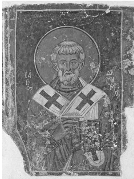
Εικ. 2. Κακοπετριά, ναός αγίου Νικολάου της Στέγης, τοιχογραφία 14ου αι.

Στις αρχές του 16 ου χρονολογείται τοιχογραφία με τον άγιο Δημητριανό όρδιο στο ναό της Παναγίας στη Χούλου της επαρχίας Πάφου 10 (εικ. 4). Στο εξωκλήσι της Παναγίας Καρδιοβαστάζουσας στα Καμινάρια ο Δημητριανός περιλαμ-