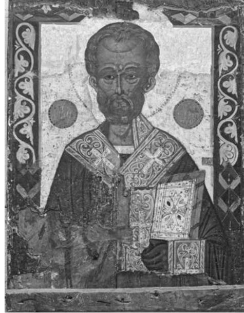
Εικ. 5. Φλάσου, ναός αγίου Δημητρίου, αμφίγραπτη εικόνα, πίσω όψη, 17ος αι.

βάνεται ανάμεσα σε Κύπριους και άλλους ιεράρχες ως εξής: Δημητριανός, Σπυρίδων, Γρηγόριος Θεολόγος, Νικόλαος, Αθανάσιος και Επιφάνιος (περ. 1523) 11 . Ως προς τα εικονογραφικά χαρακτηριστικά, οι παραστάσεις του αγίου στη Χούλου και στα Καμινάρια είναι πιο κοντά στο πρότυπο από τον Αντιφωνητή.