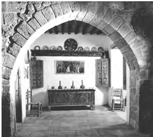
Εικ. 2 Εσωτερικό του Μουσείου Λαϊκής Τέχνης Κύπρου στα πρώτα χρόνια λειτουργίας του.

Στη συλλογή του Μουσείου Λαϊκής Τέχνης Κύπρου (εικ. 2) περιλαμβάνονται έργα λαϊκής ζωγραφικής, παραδοσιακές φορεσιές, εξάιρετα δείγματα υφαντικής, κεντητικής, αγγειοπλαστικής, μεταλλοτεχνίας, ξυλογλυπτικής, καλαθοπλεκτικής και δερματοτεχνίας, εργαλεία υφαντικής, γεωργικά εργαλεία, οικιακά σκεύη, και άλλα.