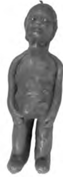
Εικ. 6 Κέρινο «τάμα» (ομοίωμα παιδιού), Δωρεά Ναού Αγίου Γεωργίου Κυθρέας 29.03.1973 (ΑΜ 2220), 36 εκ.

Η ένδερμη απόκριση των Κυθρεωτών στο κάλεσμα για τη δημιουργία μιας έκθεσης για την Κατεχόμενη Κυθρέα είναι ένας σημαντικός σταθμός για την καταγραφή αντικειμένων που επιβίωσαν της τουρκικής εισβολής του 1974 και είναι μια μοναδική ευκαιρία να συμπληρωθεί η εικόνα που έχουμε για την Κυθρέα. Άλλωστε αυτά παραμένουν «μάρτυρες» μιας άλλης εποχής και «ενθύμηση» μιας περιοχής που δύσκολα ξεχνιέται.