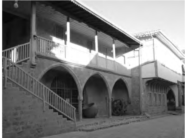
Εικ. 1 Το ιστορικό κτήριο της ΕΚΣ και του Μουσείου. Στο ισόγειο το μεσαιωνικό μοναστήρι του 15ου αι. και στον όροφο το παλαιό Αρχιεπισκοπικό μέγαρο.

Η Εταιρεία Κυπριακών Σπουδών (ΕΚΣ), ένα από τα παλαιότερα πνευματικά σωματεία του ευρύτερου Ελληνισμού, ιδρύθηκε το 1936 με κύριους σκοπούς τη συλλογή, διάσωση, μελέτη και έκδοση α) του ιστορικού υλικού, που αφορά σε όλες τις περιόδους της Ιστορίας της Κύπρου, β) του γλωσσικού υλικού, που αναφέρεται στην ιστορία και την εξέλιξη της κυπριακής διαλέκτου, γ) του λαογραφικού υλικού όλων των ιστορικών περιόδων της Κύπρου, δ) τη διάσωση και μελέτη της κυπριακής τέχνης και ε) την ίδρυση Μουσείου Λαϊκής Τέχνης (εικ. 1), 1 . Το Μουσείο Λαϊκής Τέχνης Κύπρου ιδρύθηκε το 1937 από την ΕΚΣ, σε μια καίρια περίοδο για τη διάσωση λαογραφικών κειμηλίων, αρχείων, παραδόσεων και την προώθηση της λαογραφικής έρευνας. Παράλληλα, το 1937 η Εταιρεία Κυπριακών Σπουδών εκδίδει το πρώτο ετήσιο επιστημονικό της δελτίο με τίτλο Κυπριακά Σπουδαί . Το Δελτίον (Επετηρίδα) περιλαμβάνει παντός είδους κυπριολογικού περιεχομένου επιστημονικές εργασίες (αρχαιολογικές, ιστορικές, θεολογικές, λαογραφικές κλπ) 2 .